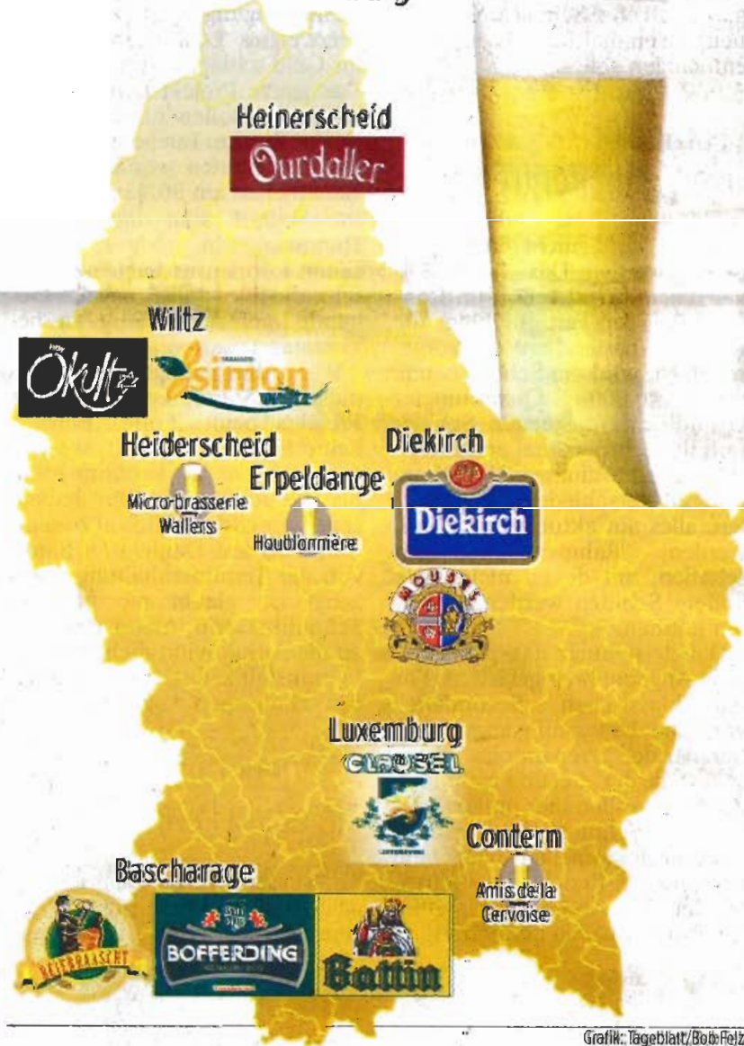
Grafik: Tageblatt/Bob Felz