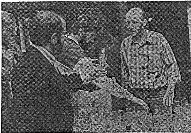
En pleine transaction

Nous nous devons de remercier d'abord les Brasseries Réunies qui ont mis à notre disposition les locaux pour cette manifestation.