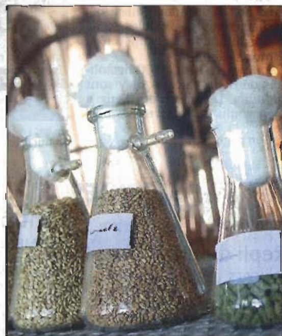
Le malt - l'un des ingrédients essentiels.